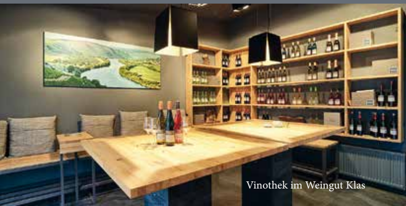
Vinothek im Weingut Klas