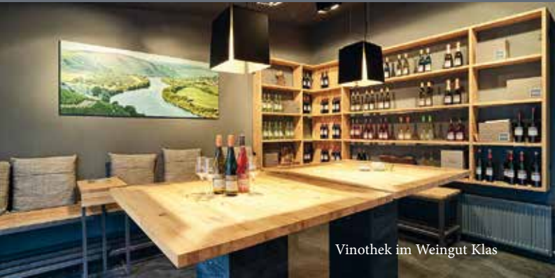
Vinothek im Weingut Klas